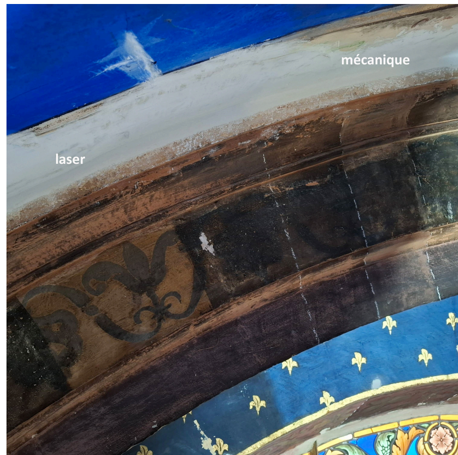
Comparaison d'essais de nettoyage par la société SMBR sur un arc de la voûte de la collégiale Saint Martin à Saint-Rémy-de-Provence.