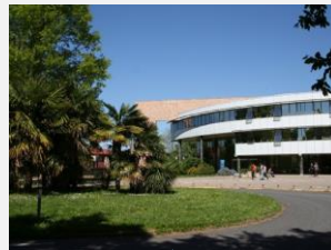
Amphithéâtre de la présidence

Organisé par l'Université de Pau et des Pays de l'Adour (UR ALTER) et l'Université Bordeaux Montaigne (UR Plurielles), en partenariat avec le Réseau régional des maisons d'écrivain et des patrimoines littéraires en Nouvelle-Aquitaine (MEPLNA) et la Fédération nationale des maisons d'écrivain et des patrimoines littéraires. Avec le soutien de la Région Nouvelle-Aquitaine dans le cadre du programme de recherche MécriNA.