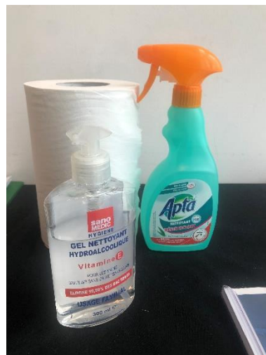
Kit par bureau, pour ordinateurs, photocopieurs imprimantes et sanitaires