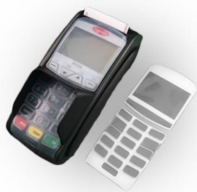
Protection clavier en silicone