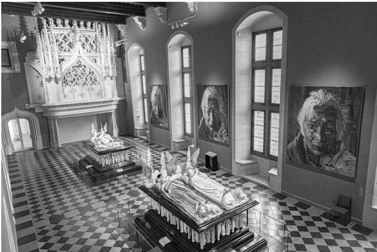
Salle des Tombeaux, musée des Beaux-Arts, Dijon