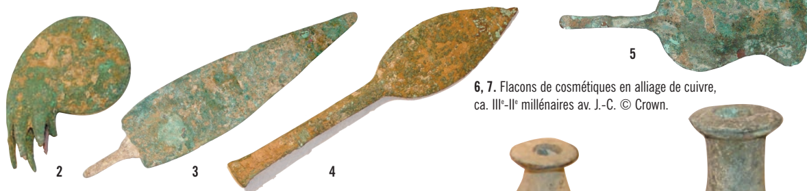
2 à 5. Pointes de flèche et de lance en cuivre et fers de hache ouvragés, III e -II e millénaires av. J.-C.

Les outils en cuivre présentent souvent des signes de forte corrosion. On trouve des lames plates, des pointes de flèche, des fers de hache, des perceurs, des lames et des haches ouvragées de différentes formes et longueurs. [illus. 2, 3, 4, 5]