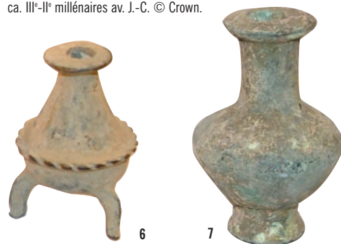
6, 7. Flacons de cosmétiques en alliage de cuivre, ca. III e -II e millénaires av. J.-C.

Petits récipients parfois montés sur trois pieds et revêtant la forme d'un animal. Certains sont munis d'une tige servant à appliquer le produit cosmétique. [illus. 6, 7]