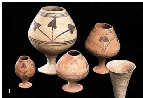
1. Gobelets en terre décorés de feuilles de pipal, de Mundigak, III e millénaire av. J.-C., H. 9 à 19 cm.

Les formes et les motifs floraux qui ornent ces poteries sont caractéristiques du plus ancien site protohistorique d'Afghanistan. [illus. 1]