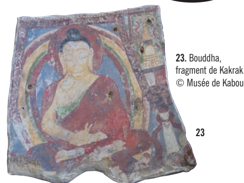
23. Bouddha, fragment de Kakrak.

Les fragments de peintures murales sont essentiellement composés de pigments à base de couleurs primaires (rouge, bleu, vert, jaune). Les contours des personnages sont soulignés d'un trait noir. La peinture se compose d'une sous-couche de blanc sur un fond constitué de mortier et de matière végétale. Les sujets varient mais représentent souvent des figures du Bouddha. [illus. 23]